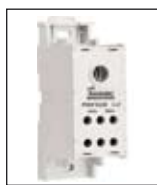
Bloques de distribución de energía