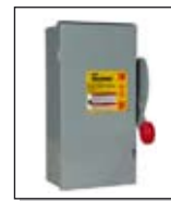
Interruptores de seguridad de CA y CD