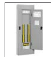
Tableros de Coordinación Selectiva Quik-Spec