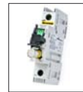
Protectores compactos de circuito