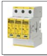
Protección contra sobrecargas transitorias