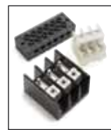
Organización del cableado